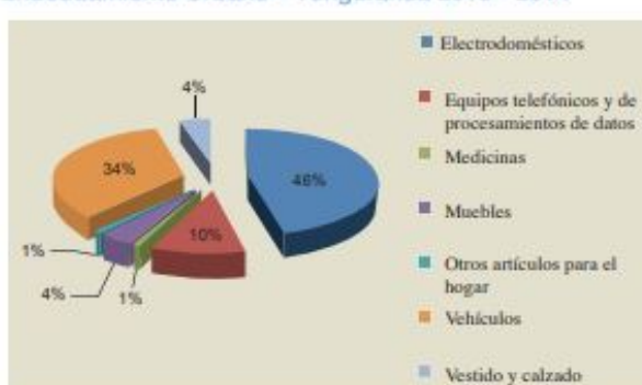
Figura 4 Endeudamiento Urbano - Tungurahua 2013 - 2014

Fuente: Instituto Nacional de Estadística y Censos (INEC) ECV 2013-2014 Elaboración: Equipo OBEST