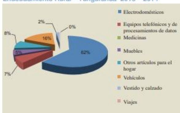
Figura 3 Endeudamiento Rural - Tungurahua 2013 - 2014

Fuente: Instituto Nacional de Estadística y Censos (INEC) ECV 2013-2014 Elaboración: Equipo OBEST