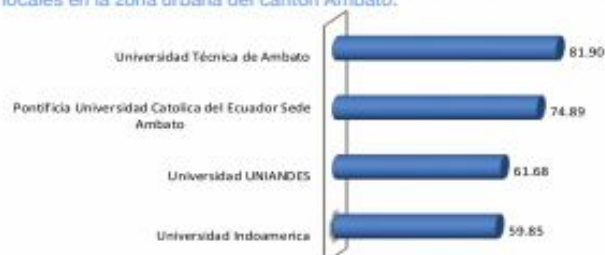
Figura 13 Índice de percepción ciudadana sobre la imagen de las Universidades locales en la zona urbana del cantón Ambato.

Fuente: Formulario encuesta junio 2015 Elaboración: OBEST