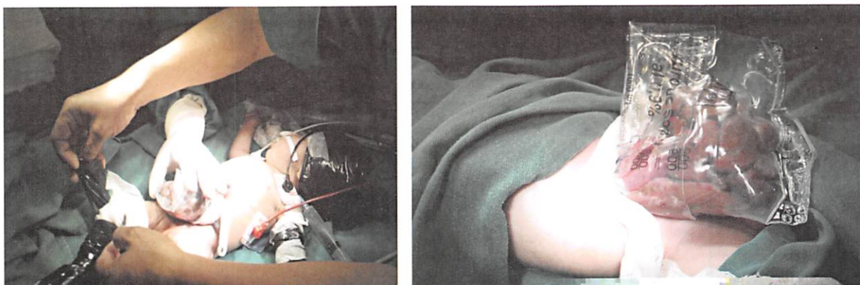
FIGURA 2: Colocación de una bolsa plástica estéril (como bolsa de Bogotá) para cubrir asas intestinales