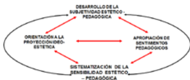
Figura 1. Relación de la sistematización axiológica de lo estético-pedagógico en la formación profesional de los docentes.