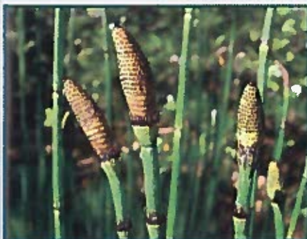
Cola de caballo