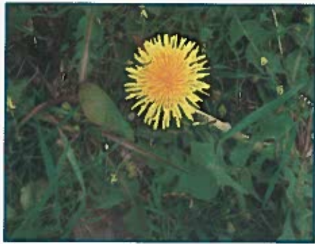
Diente de león