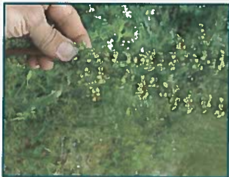
Lengua de vaca