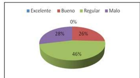
Figura No.1 Calidad De Vida Del Adulto Mayor .Artritis Reumatoidea

más temprano de su enfermedad que los no fumadores, de la misma manera la actividad y la discapacidad por ella producida tanto al momento basal como tras dos años de seguimiento. [4]