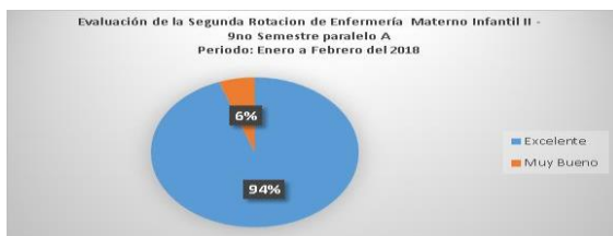
Gráfico 2. Evaluación de segunda rotación

Es importante indicar que este grupo de 18 estudiantes inició la rotación el 1 de Noviembre al 31 de Diciembre del 2017, del mismo año, por lo tanto la evaluación realizada ha sido de 2 meses de rotación, considerándose que los resultados de aprendizaje propuestos han sido cumplidos, donde los estudiantes han demostrado sus habilidades y destrezas en cada uno de los procesos académicos y prácticos, así mismo se recalca que el resultado obtenido se atribuye a que han realizado sus pasantías de internado rotativo en el noveno semestre lo que fortalece el proceso enseñanza aprendizaje.