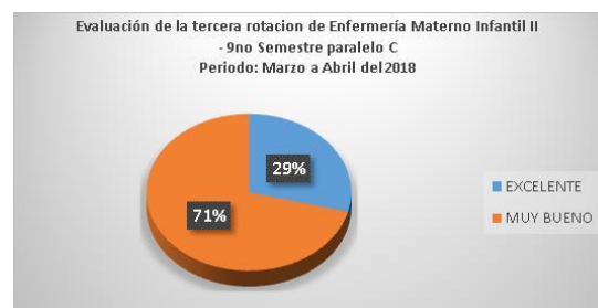
Gráfico 3. Evaluación de tercera rotación

promedio de excelente con el 94% y de 7 estudiantes el 6% de calificación muy buena esto nos indica que los estudiantes de intentado rotativo poseen un nivel de conocimiento alto y medio con la temática del proceso académico de la carrera de enfermería además es importante indicar que este grupo de 18 estudiantes inició la rotación el 1 de Enero al 28 de febrero del 2018, por lo tanto la evaluación realizada ha sido de 2 meses, considerándose que los resultados de aprendizaje propuestos han sido cumplidos demostrado sus habilidades y destrezas en cada uno de los procesos académicos y prácticos fortaleciendo el proceso enseñanza aprendizaje.