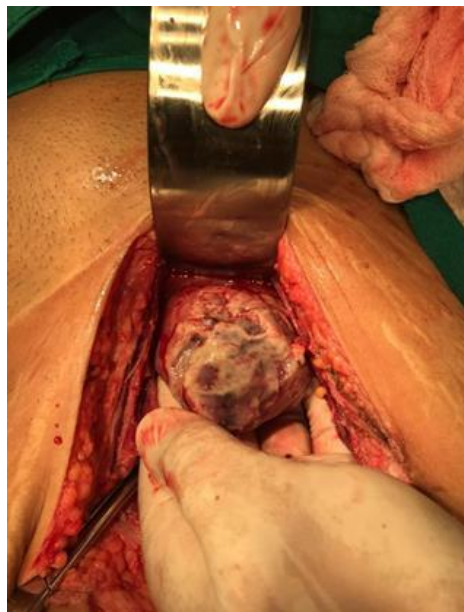
Imagen 3. A. Masa quística de ovario derecho necrosada.