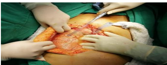
Imagen 2. Laparotomía exploratoria, se aprecia líquido purulento libre en cavidad abdominal.