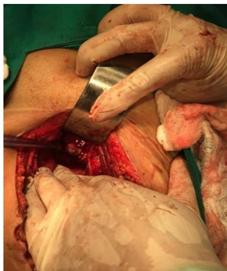
Imagen 3. B. Cavidad pélvica retroperitoneal donde se ubicaba la masa ovárica