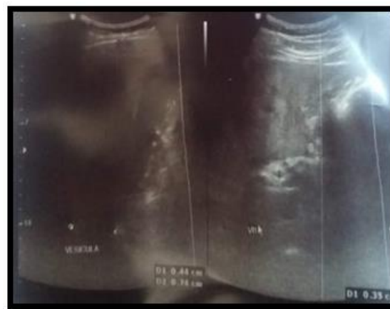
Figura 1. Ecografía de abdomen superior preoperatoria. Vesícula de pared engrosada, calculos en su interior.

gico con tinte icterico en facies. CARDIOPULMONAR sin patología aparente. ABDOMEN: suave, depresible, doloroso a la palpación en hipocondrio derecho y a la palpación profunda en flanco derecho, Signo de Murphy positivo, ruidos hidroaéreos positivos, sin signos peritoneales. En los exámenes de laboratorio encontramos: BIOMETRIA HEMÁTICA: Glóbulos Blancos 14.75 10e3/ \mu L, linfocitos 24,3 %, Neutrófilos 10.34 10e3/ \mu L – 70.2%, hemoglobina 16.9 g/dl, hematocrito 52.1%. QUÍMICA SANGUÍNEA: glucosa basal 107 mg/dL, urea 32mg/dL, creatinina 1.01 mg/dL, T.G.O (AST) 44 U/L, T,G,P (ALT) 70 U/L, GAMA G.T 103 U/L, fosfatasa alcalina 118 U/L, amilasa 38 U/L, lipasa 56 U/L, bilirrubina total 1.87 mg/dl, bilirrubina directa 1.2 mg/dl, bilirrubina indirecta 0.67 mg/dl. SEROLOGÍA: PCR 185.59 mg/L. COAGULACIÓN SANGUÍNEA: dentro de parámetros normales. En el examen de imagen la ECOGRAFÍA DE ABDOMEN SUPERIOR nos reportan hígado de forma y tamaño normal, con presencia de infiltrado esteatósico difuso moderado. Vesícula de paredes engrosadas y lodo biliar en su interior, con múltiples cálculos con un diámetro entre 4 a 7.4 mm. ( Figura 1 ).