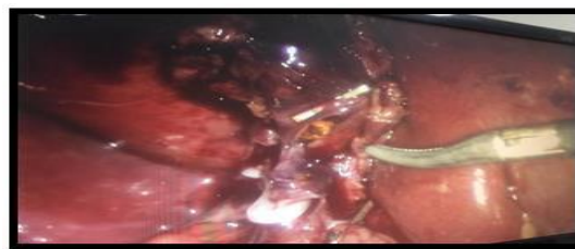
Figura 4: Hallazgos en procedimiento quirúrgico colecistectomía laparoscópica. Tejidos vesiculares friables, hematoma contiguo a tejidos vesiculares.