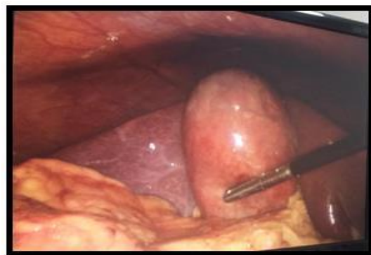
Figura 5. Vesícula biliar con cálculos mixtos y barro biliar

Dándonos los siguientes diagnósticos definitivos: Colecistitis hemorrágica y Colelitiasis (cálculos mixtos) FIG:5.