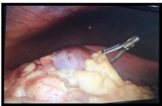
Figura 3: Hallazgos en procedimiento quirúrgico colecistectomía laparoscópica. Vesícula tensa, necrótica, edema peri-vesicular