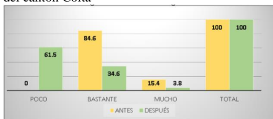
Figura #2. Evaluación de rigidez articular

cuestionario WOMAC acerca de la rigidez articular, se observa, los 26 pacientes que representan el 100% de la totalidad del proyecto de investigación, de los cuales, en la primera evaluación ningún paciente presenta poca rigidez articular, mientras en la segunda evaluación después de la intervención con la técnica FNP, se observa, una mejoría en los 16 pacientes que representan 61,5% que nos indican con poca rigidez articular. El presente análisis de resultados corresponde a la segunda evaluación después de la intervención con la técnica FNP en los adultos mayores del centro gerontológico GAD municipal del cantón Colta