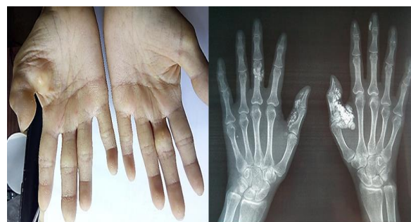
Figura 1. Calcinosis en manos de la paciente

Fuente: Datos tomados de la historia clínica