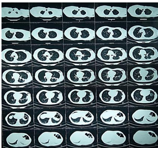
Figura 2. Tomografía pulmonar que evidencia lesión quística cavitada.

Fuente: Datos tomados de la historia clínica