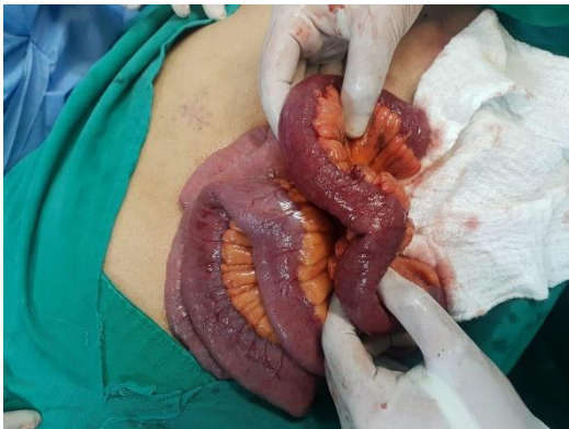
Figura 3. Isquemia segmentaria de yeyuno e íleon