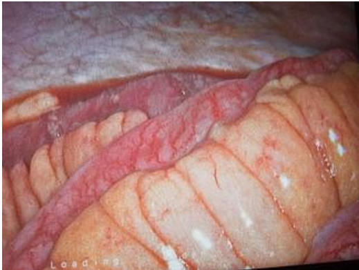
Figura 2. Laparoscopia diagnóstica