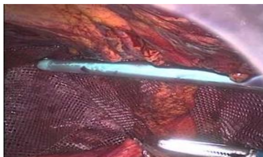
Figura 4. Fijación de Malla con secure Strap