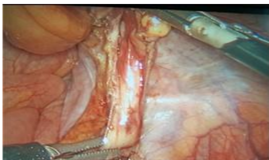
Figura 1. Identificación de estructuras: saco herniario con contenido de apéndice