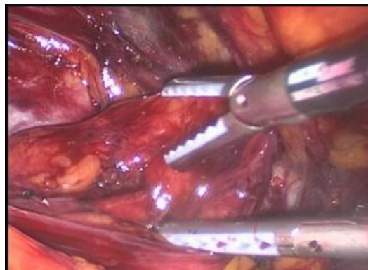
Figura 2. Tracción de contenido de saco herniario